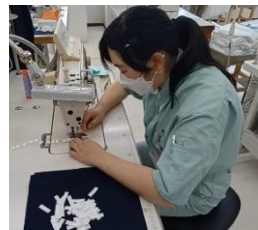
【現場実習】 縫製作業