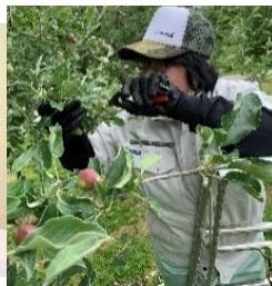
【校内実習】 農耕班 (りんごの摘果)