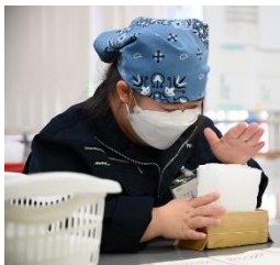
【校内実習】 丸三化成班 (ポリパックの結束)

現場実習、地元実習では、それぞれの実習先であいさつや返事、報告など、作業学習や校内実習などで学んだことを生かして取り組みました。特に、3年生は、卒業後の生活を見据え、実習先での作業だけでなく、家庭での過ごし方、体調の整え方なども意識して行いました。事後学習では、それぞれの成果と課題を振り返りました。後期実習に向け、そして卒業後に向けて、日々の生活の中で成果は継続し、課題は改善していけるように取り組んでいきたいと思ひます。