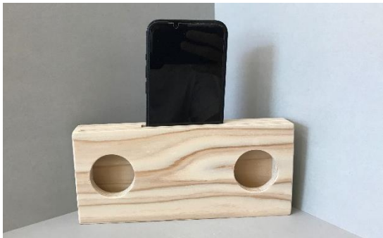
スマートフォンスピーカー