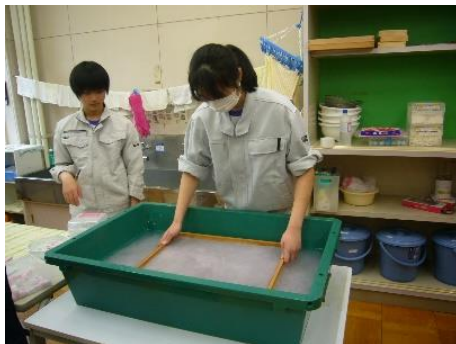
牛乳パックを再利用した紙製品

牛乳パックを再利用して紙を作っています。牛乳パックを切る、フィルムはがし、紙ちぎり、ミキサーがけ、紙すきの工程で製作します。